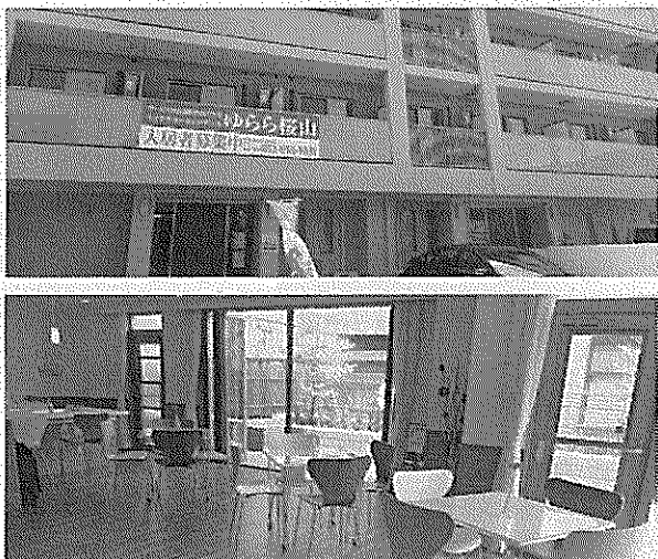
サ付き住宅の外観。住宅街に立地(上)、北政をイメージしたミニシアター(下)

デイサービスは介護予防プログラムに特化した、スリングエクササイズ機器「レッドコード」を導入。デイの介護スタッフがトレーナーとしてプログラムを実施する。介護予防・リハビリ特化型デイサービスの展開は東京に続いて2カ所目。1日の介護予防事業を受託する居者がデイサービススペースを利用してできるように、二次予防事業対象の高齢者向けに介護予防プログラムを実施する。その意識向上につなげる。またこのデイサービスプログラムを実施する。地域住民に開放すること、地域の中に供給していきたい。