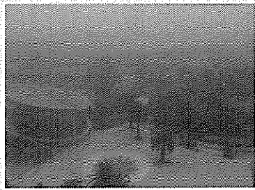
▶PM2.5で数百メートル先の景色が見えない状態

中国は防空識別圏設定や大気汚染など数々の問題を抱えています。11月6日上海市は微粒子状物質PM2.5濃度測定値が600マイクログラムを超えて6段階で深刻な汚染の状態で見え、高速道路も一部閉鎖され、学校も休みになり街行く人もまばらの状態で住民の生活にも大きな支障をきたしました。この時ばかりは私も外出を控えました。とても人間が生活できる場所ではない状態です。